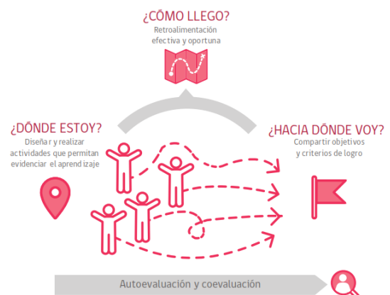
Figura 1. Preguntas y estrategias centrales de la evaluación formativa.

Artículo 7: La evaluación formativa en el aula debe considerar metas de aprendizajes, clarificar los criterios de logro y recolectar evidencia, a través de diferentes estrategias, interpretar las evidencias, identificar los avances o brechas de aprendizaje, retroalimentar para afianzar los aprendizajes o acortar la brecha (según corresponda), realizando ajustes en el proceso de enseñanza y aprendizaje.