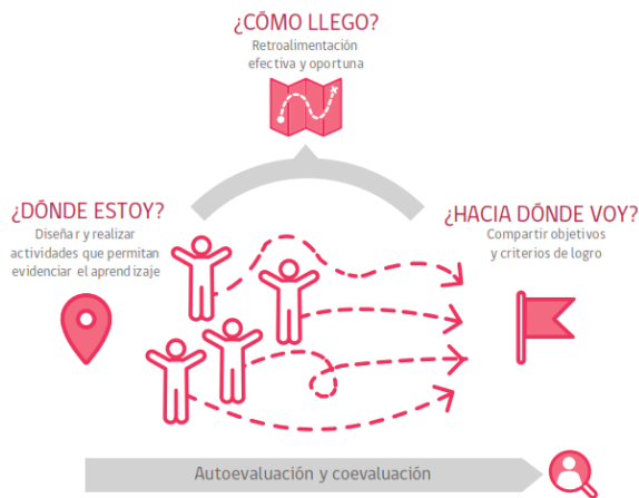
Figura 1. Preguntas y estrategias centrales de la evaluación formativa.

Artículo 7: La evaluación formativa en el aula debe considerar metas de aprendizajes, clarificar los criterios de logro y recolectar evidencia, a través de diferentes estrategias, interpretar las evidencias, identificar los avances o brechas de aprendizaje, retroalimentar para afianzar los aprendizajes o acortar la brecha (según corresponda), realizando ajustes en el proceso de enseñanza y aprendizaje.